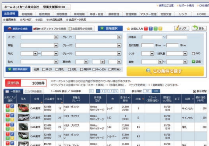
一発落札のワンプライス車両も多数出品!