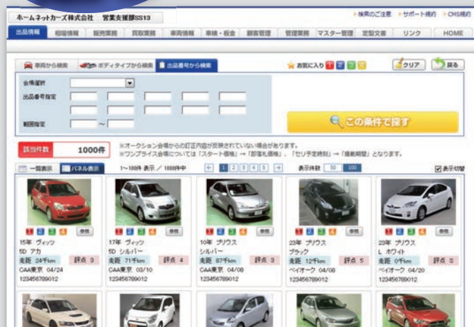
専用パソコンで全国の出品車両が閲覧可能